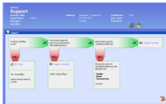
Bild 1, iSupport

I grunden måste alla kunder som önskar tjänsten vara anslutna mot COS- Coordinator Online Service och därigenom bruka iOnline hänvisning- och informationssystem på Internet (läs mer under tjänster på hemsidan).