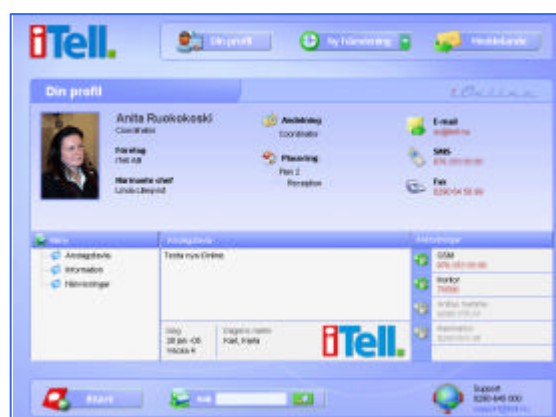
Bild 1, Visitkort och information